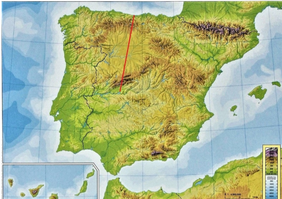
Esquema N-S de la planura del Duero i els seu enllaç amb les muntanyes. Méndez, R. ; Molinero, F. Coords. ( 1993 ): Geografía de España . Barcelona: Ariel