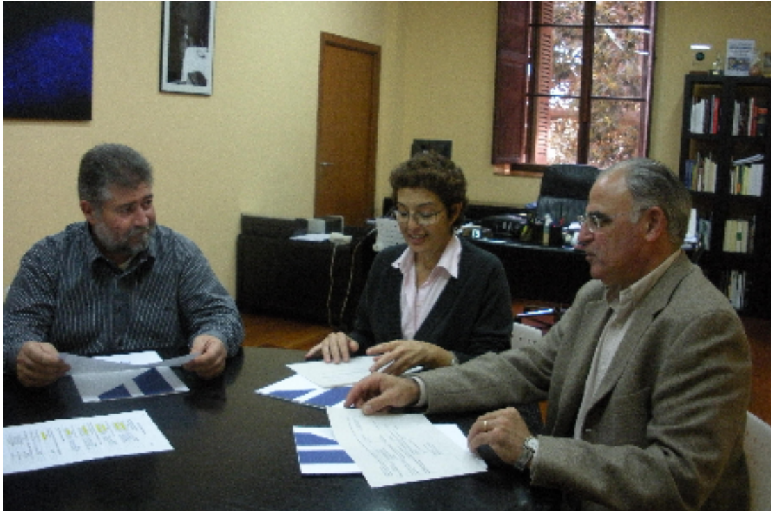
Visita de la presidenta i del vicepresident del CEM al nou conseller executiu de Cultura i Patrimoni

Les comissions específiques estan integrades pels consellers que proposa la Comissió Permanent, i n'hi ha d'haver un mínim de cinc i un màxim de vuit.