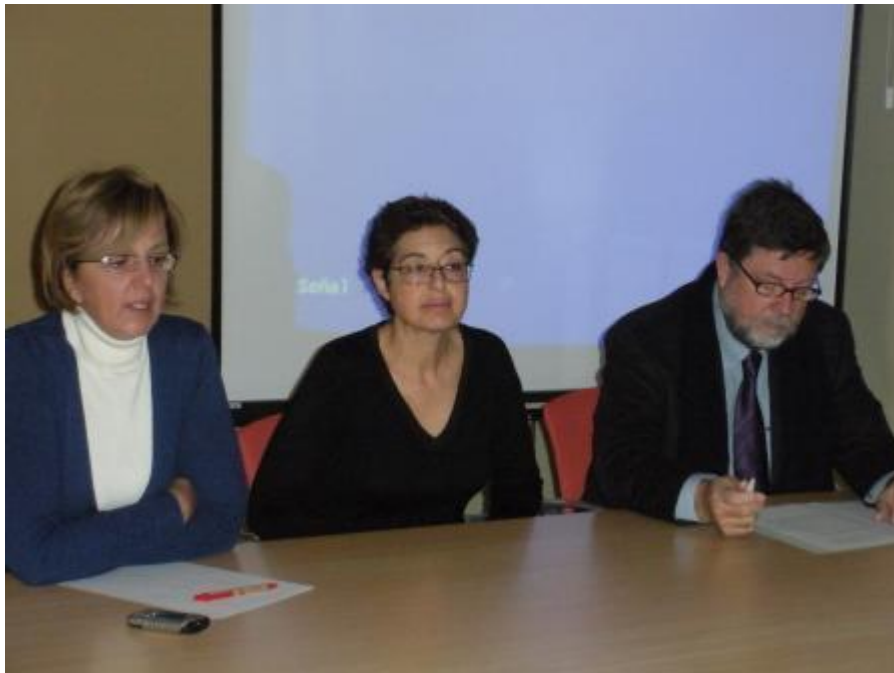
Presentació de les Jornades sobre consells escolars municipals

Podeu llegir les conclusions d'aquesta jornada a l'apartat 8.1 d'aquesta memòria.