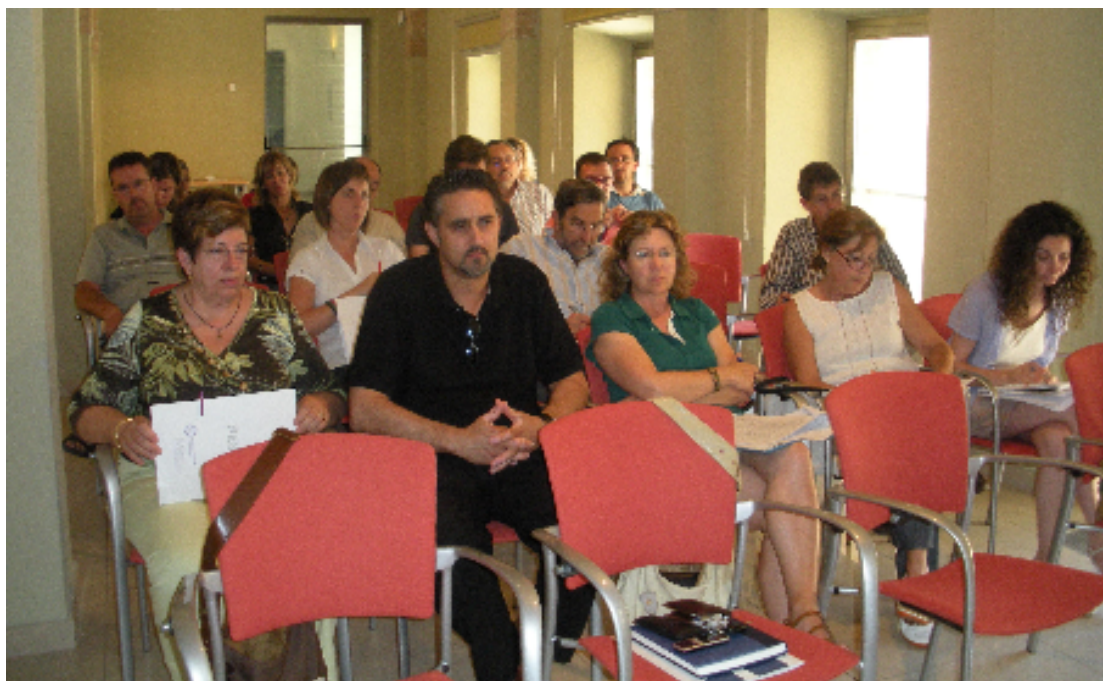
Sessió plenària del mes de juny de 2009