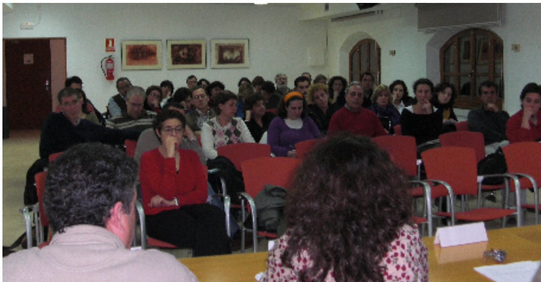
Públic assistent a la taula rodona sobre menjadors escolars