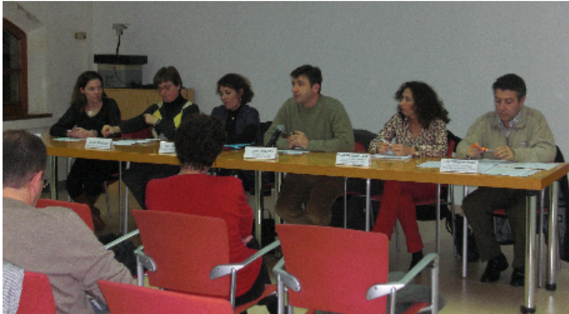
Membres participants a la taula rodona sobre menjadors escolars